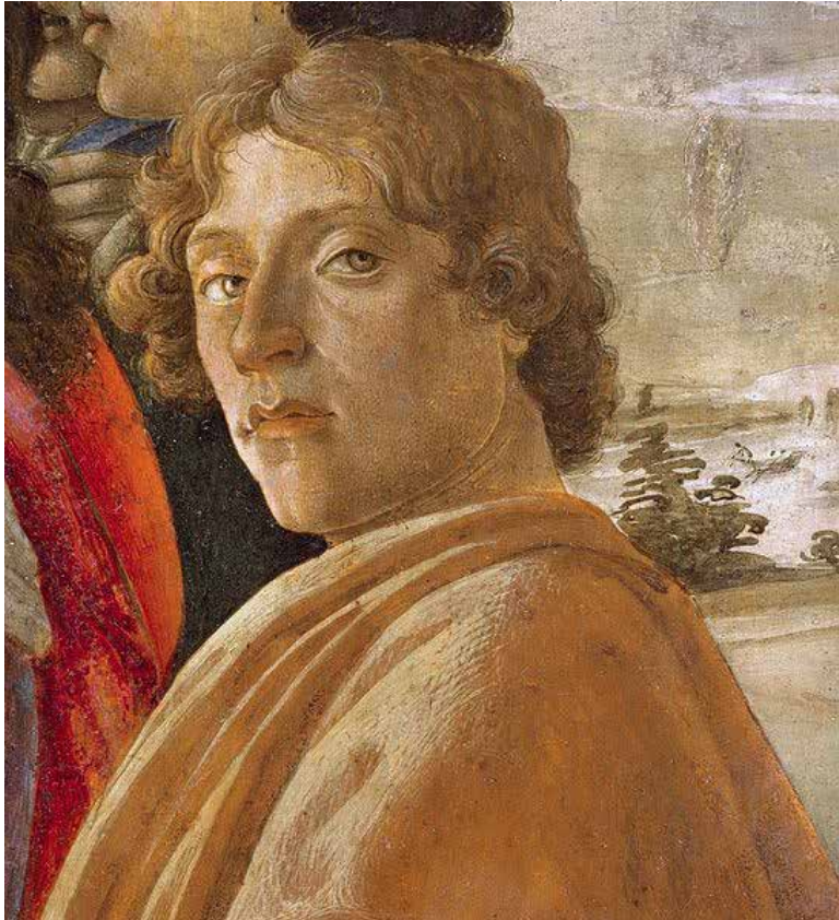
Πιθανή αυτοπροσωπογραφία του Botticelli (1475)

Νέες υποθέσεις αναφέρουν ότι αυτός ο άνθρωπος που ονομαζόταν Χριστόφορος Κολόμβος (αυτός που φέρει τον Χριστό και το Φως του Αγ. Πνεύματος), θα οδηγούσε τις καρβέλες του με τους ναϊτικούς σταυρούς στα πανιά, μέσα από θαλάσσιες διαδρομές που γνώριζαν ήδη οι Μυημένοι σ' αυτές τις «αδελφότητες» εδώ και πολλούς αιώνες. Βασιζόταν σε ναυτικούς και ιστορικούς χάρτες της εποχής των Πτολεμαίων και των Ρωμαίων, όπως το αντίγραφο του